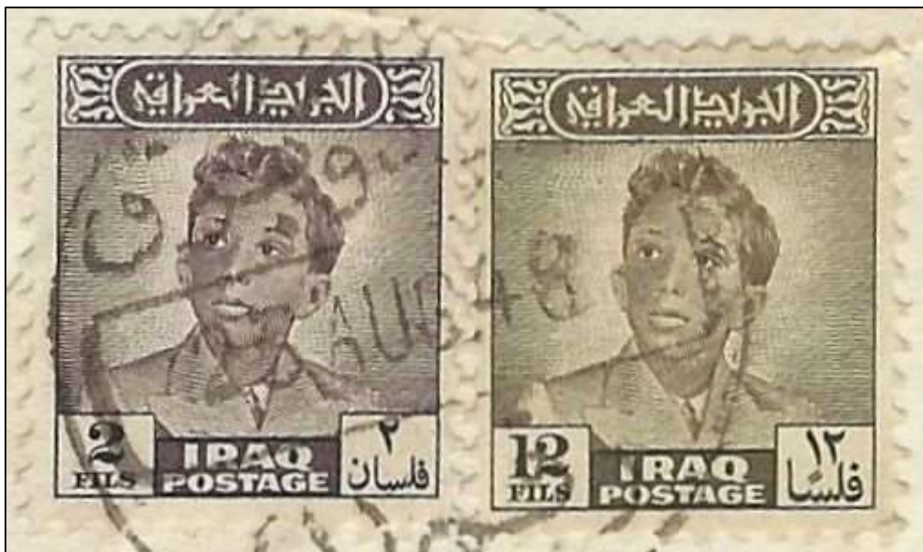
בולים עיראקיים שהודבקו על מעטפה צבאית

משרדי שירות דואר השדה חדלו מלפעול עם חזרתו של חיל המשלוח העיראקי מירדן בחודש נובמבר 1950.