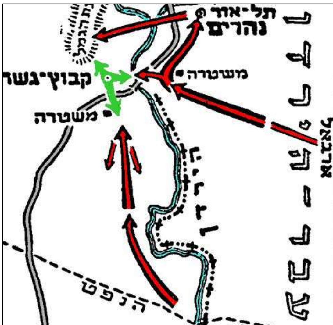
קרב גשר, 17-20 במאי 1948

בחודש אפריל 1948 התארגן בעיראק כוח צבאי בסדר גודל של דיוויזיה (אוגדה) שנועד להצטרף לכוחות הערבים שעמדו לפלוש לארץ ישראל מיד לאחר תום המנדט הבריטי. ב-15 במאי 1948 חצו הכוחות העיראקים את נהר הירדן, תקפו את קיבוץ גשר וניסו להשתלט על רכס כוכב הירדן. שתי המתקפות כשלו מול ההתנגדות של הכוחות היהודיים, והצבא העיראקי ריכז את כוחותיו בשני מוקדים באזור צפון השומרון.