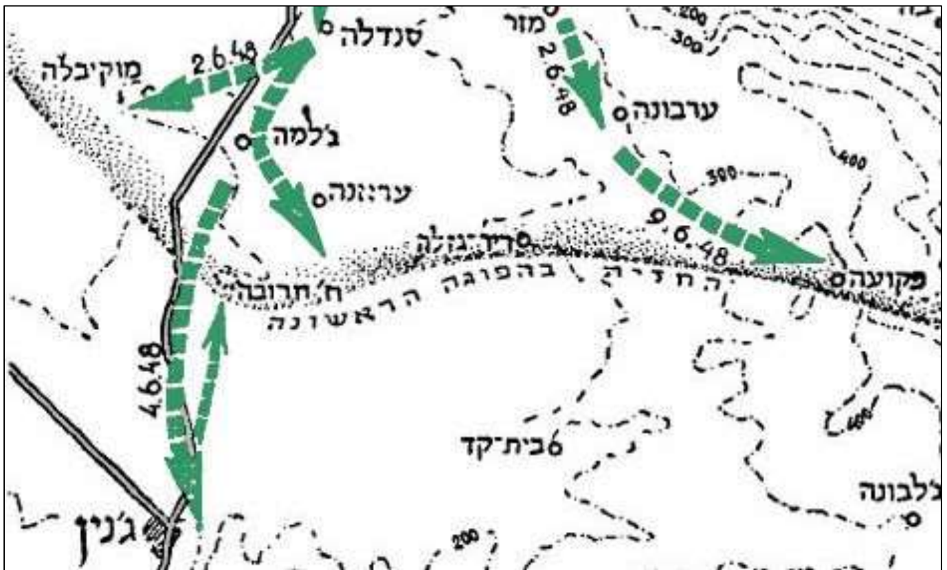
קרבת ג'נין, 1-4 ביוני 1948

אחד המוקדים היה בעיר ג'נין, משם תוכנן לתקוף את עמק יזרעאל, והמוקד האחר היה באזור המשולש (שכם, טול כרם וקלקיליה), משם תוכנן לתקוף לעבר חוף הים ולבתר את מדינת ישראל שזה עתה נולדה.