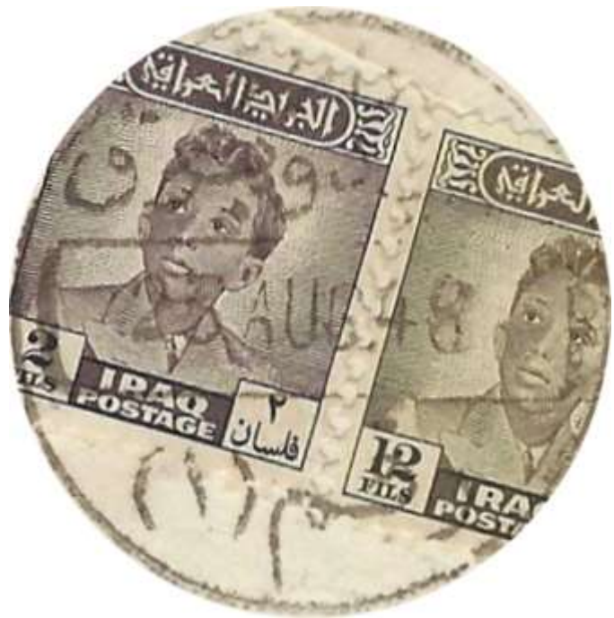
חותמת הדואר הצבאי מקור

ממחקריו של מר רשתי ידוע על קיומם של שלושה אזורים: "אזור 1", "אזור 2" ו-"אזור 3".