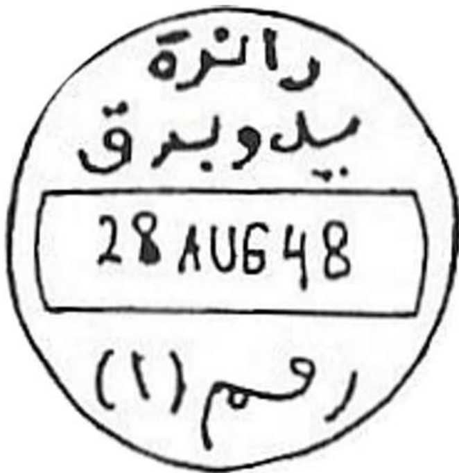
חותמת הדואר הצבאי העתק

בחלק התחתון של החותמת נרשם בערבית האזור בו שימשה החותמת (אזור 1).